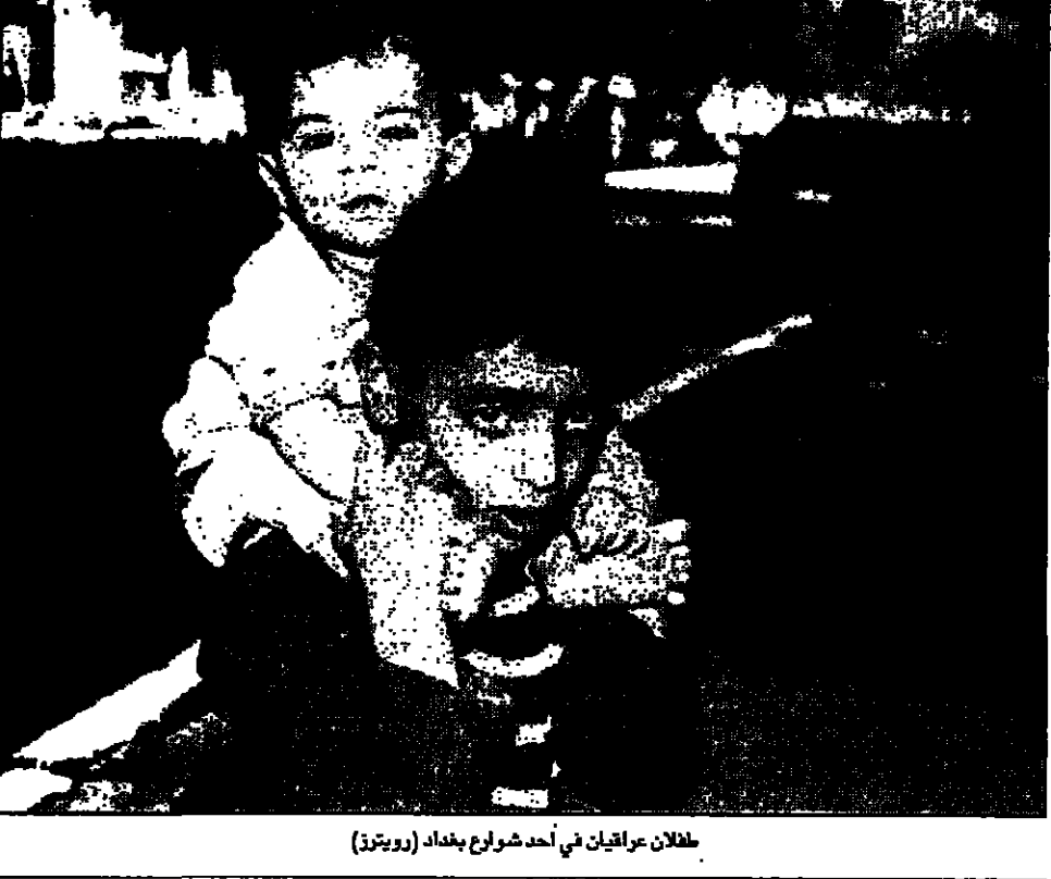
طلال عراقيان في أحد مشروعات بغداد

بغداد - «القدس العربي» - عان: أكد زعيم جبهة خريجي المدارس الأجنبية في العراق، طالباني، ان أي محاولة لإسقاط صدام حسين من قبل القوى الخارجية لن تنجح. وقال طالباني في مقابلة مع صحيفة «القدس العربي» امس الخميس، ان القوى الخارجية لن تنجح في إسقاط صدام حسين من العراق، بل ستؤدي إلى مزيد من الدمار. وأضاف طالباني ان القوى الخارجية لن تنجح في إسقاط صدام حسين من العراق، بل ستؤدي إلى مزيد من الدمار.